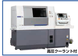
高圧クーラント付