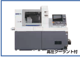
高圧クーラント付