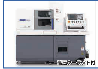
高圧クーラント付