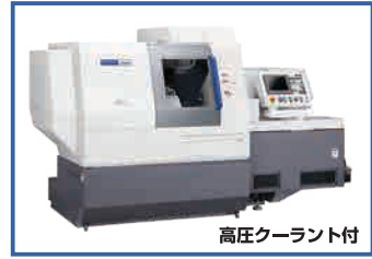
高圧クーラント付