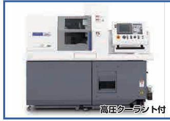
高圧クーラント付