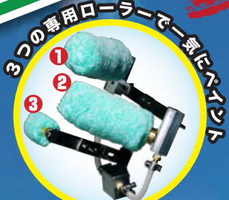
シャフトレスタイプ