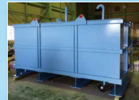
【船舶用のタンク】 この製品は船舶用のタンクです。容量は10m³です。