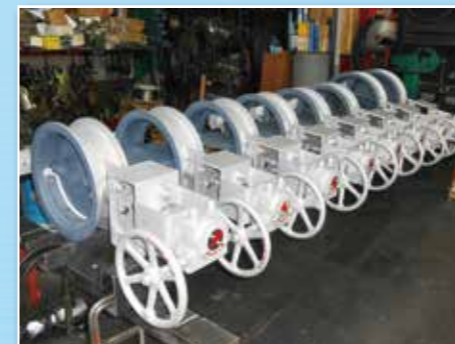
【手動式ダンバ】 各地方自治体（おもにごみ焼却施設・電力会社）に使われるプラント機器です。

製図がないような物でも、お客様とご相談の上、製作が可能です。 他社で断られた様なものでも、一度ご相談ください。